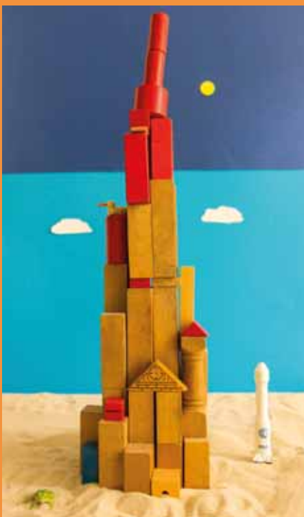
Welk perspectief is dit?

Je ziet de wereld vanuit het perspectief dat je inneemt. Schilders gebruiken het kikker- en vogelperspectief. In kikkerperspectief neem je een laag standpunt in. Dat betekent dat je van onderaf naar iets kijkt. In vogelperspectief neem je een hoog standpunt in. Je staat bijvoorbeeld op een berg en je kijkt uit over een landschap.