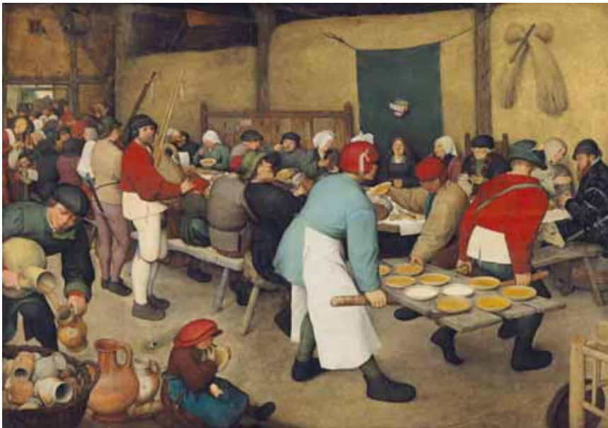
Pieter Bruegel de Oude De boerenbruiloft, 1567 Kunsthistorisches Museum, Wenen