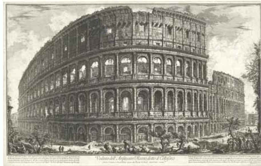
Giovanni Battista Piranesi, Colosseum te Rome, 1748-1778. Rijksmuseum, Amsterdam